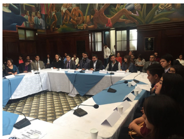
Representantes de la UUGT en actividad apoyada por NIMD.

Nosotros nos preguntábamos ¿Dónde aprende uno sobre política? ¿Iniciativas de ley, comunicación, lobbying, negociación, planificación estratégica? Gracias a los procesos de formación del NIMD Guatemala aprendí muchas herramientas para la acción política.”