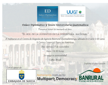
Convocatoria Foro realizado en Quetzaltenango en el 2017 sobre el rol de la juventud.