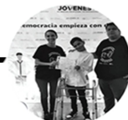
Personas con discapacidad