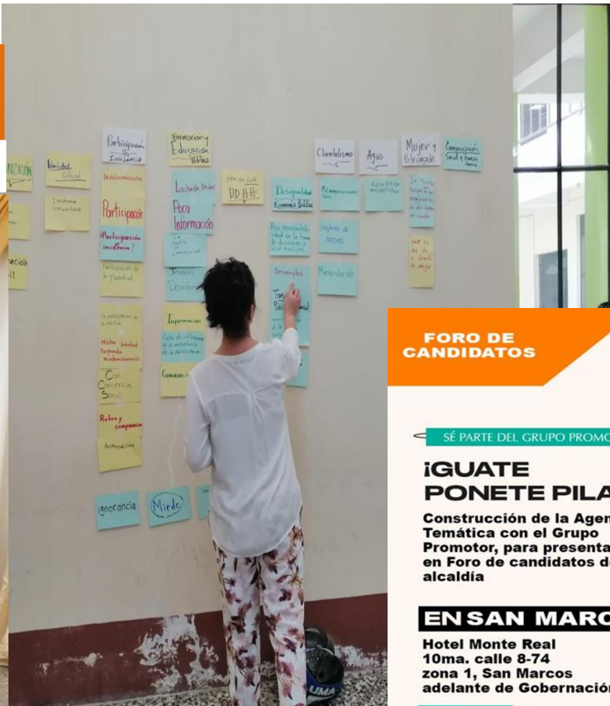
Taller Santa Cruz, el Quiché 10 mayo 2023