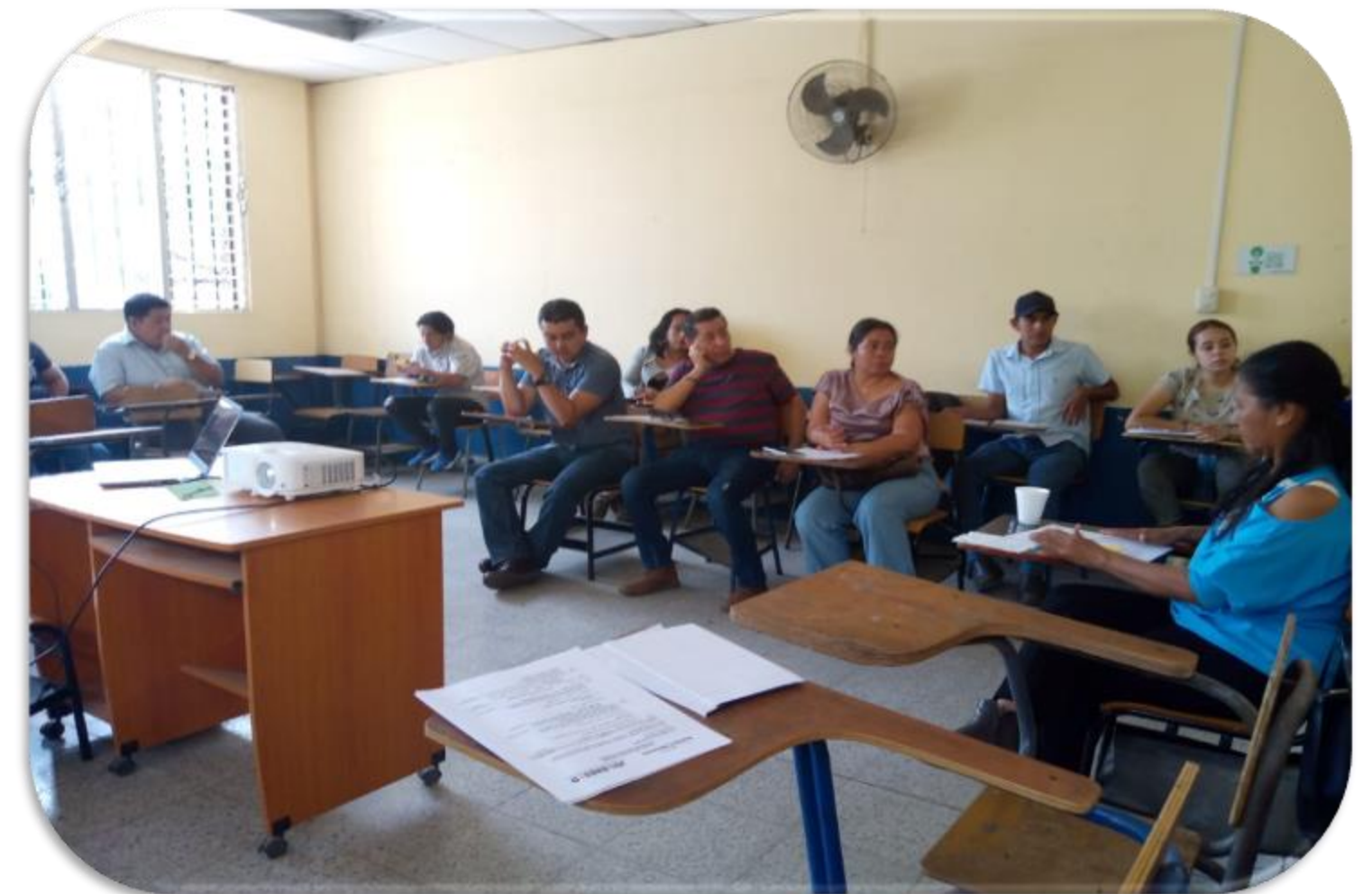
Chiquimula, 13 mayo 2023