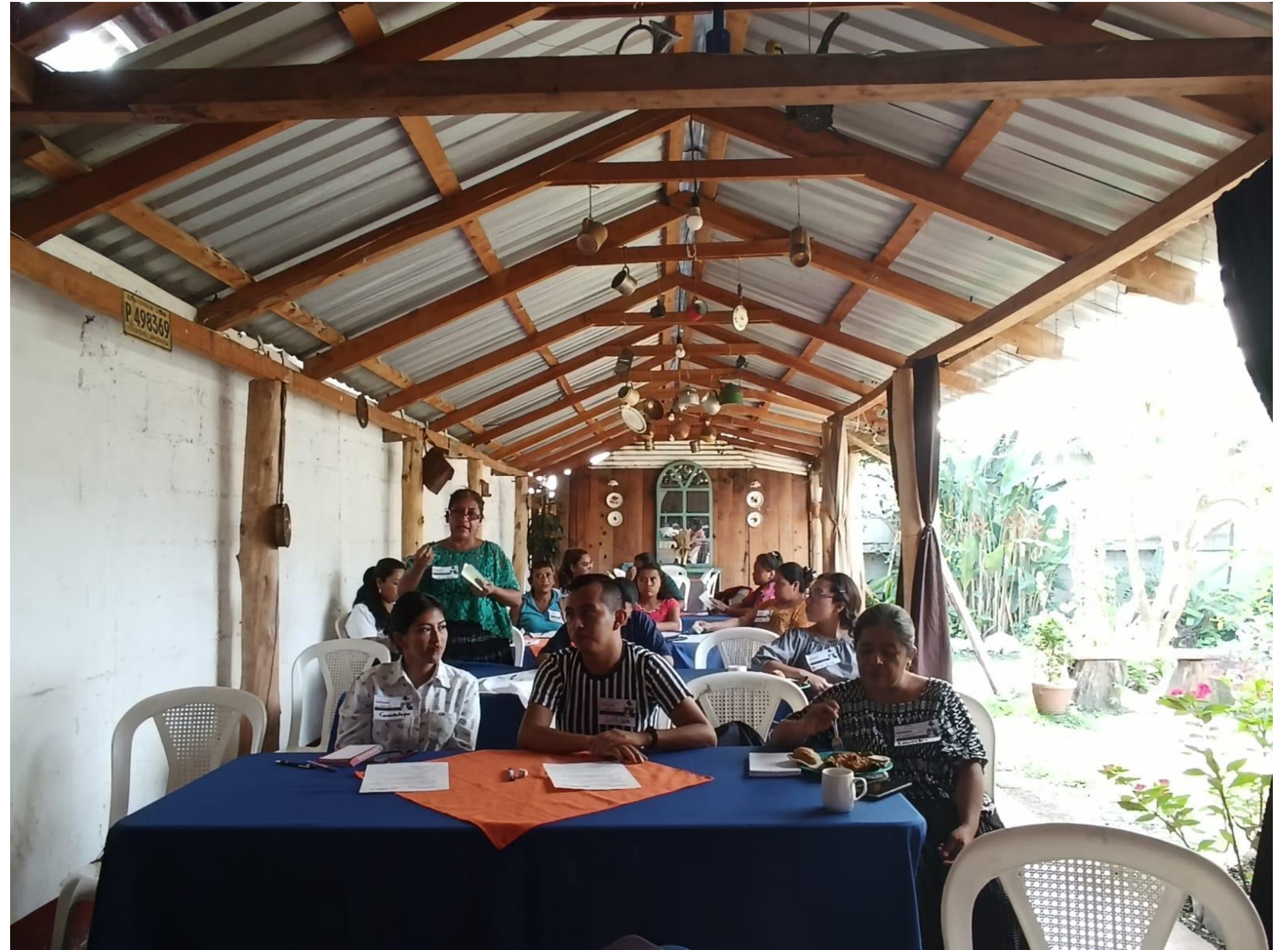
San Cristóbal Verapaz, 15- mayo - 2023