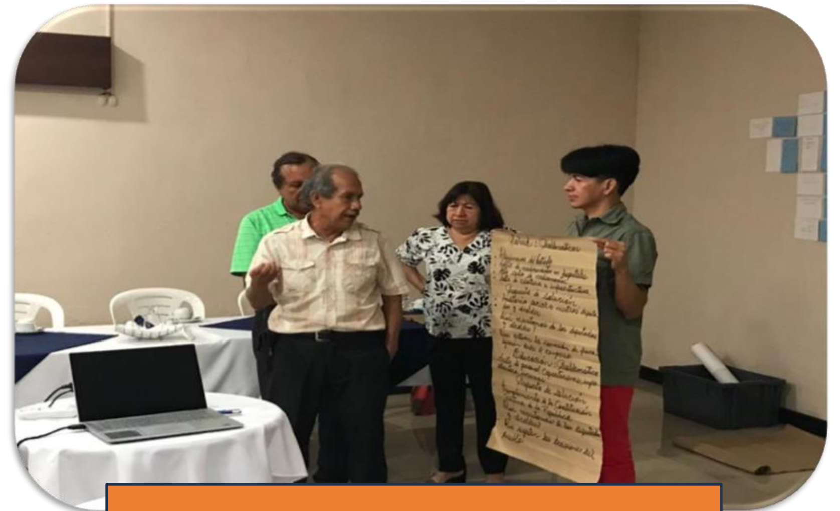
Retalhuleu, 05- mayo - 2023