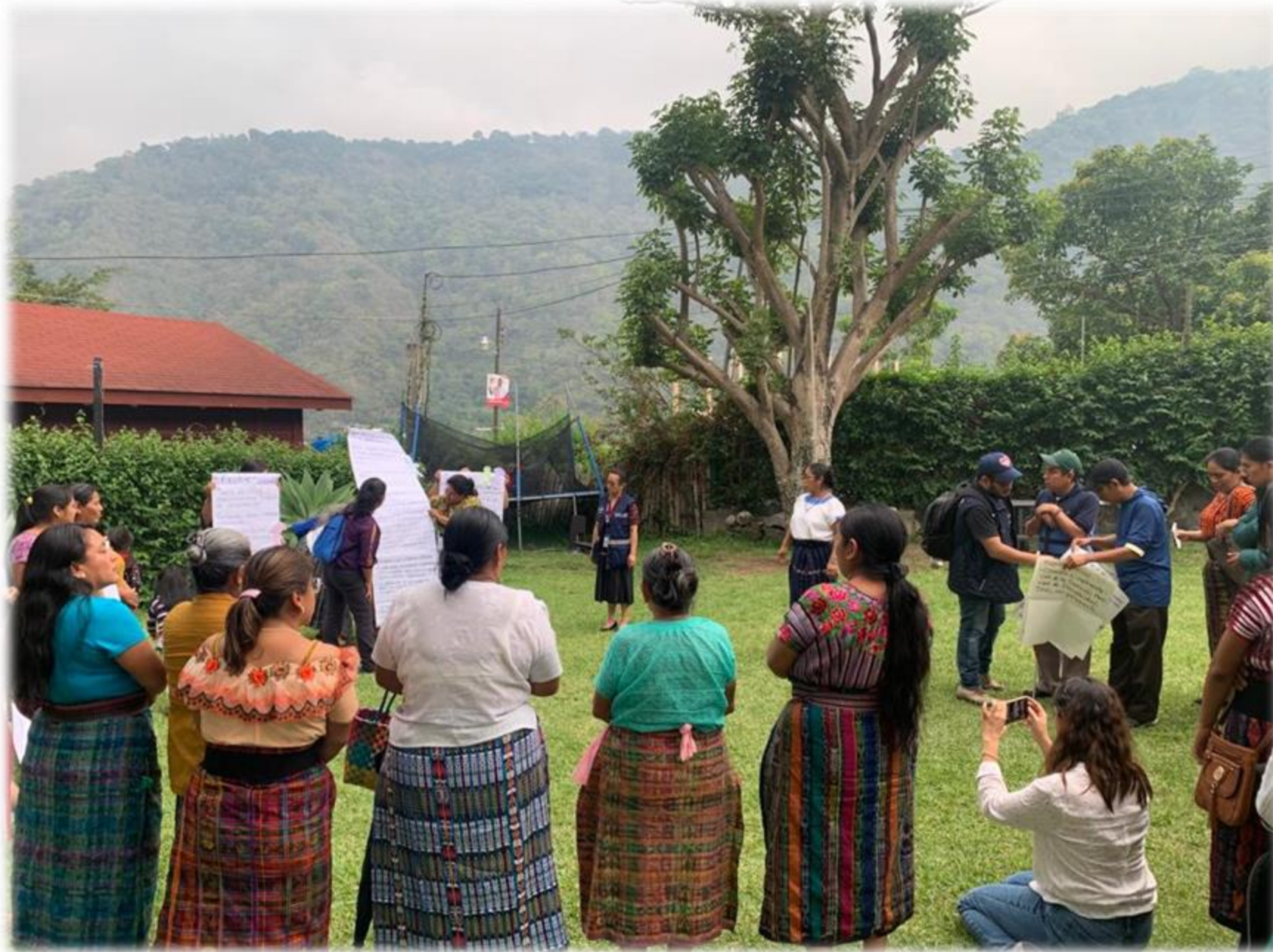
San Lucas Tolimán, Sololá 11-05-22

Reuniones para la Construcción de Agendas Ciudadanas.