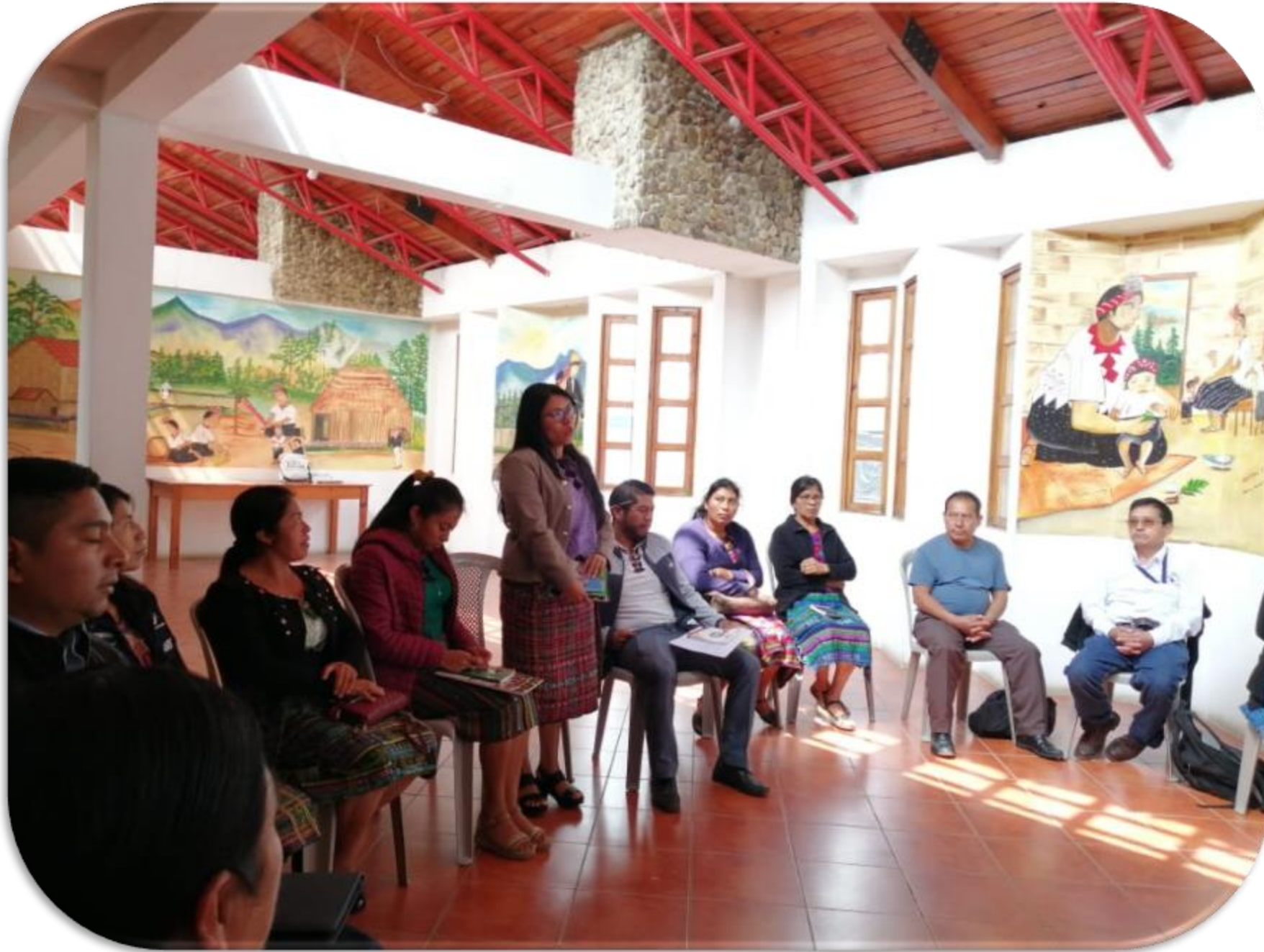
San Juan Cotzal, Quiché 15- mayo - 22