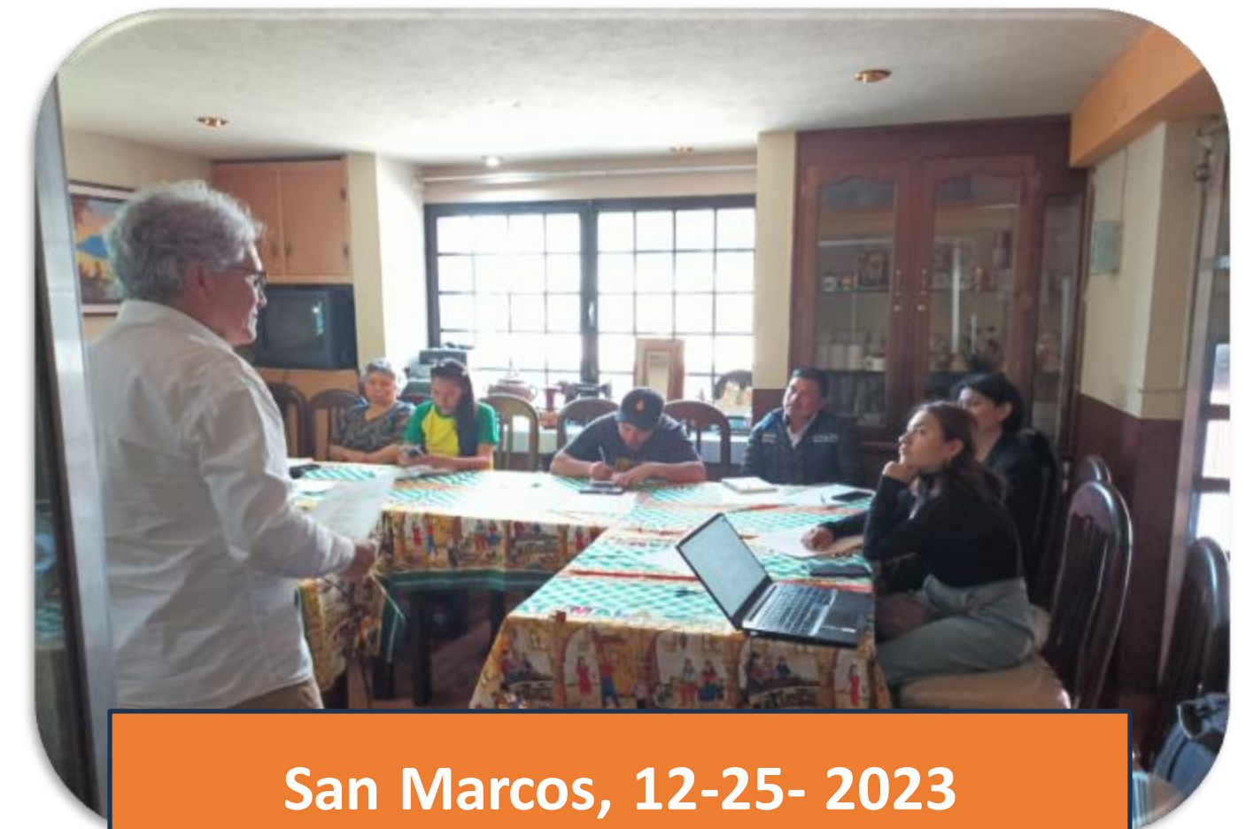
San Marcos, 12-25- 2023

Reuniones para la Construcción de Agendas Ciudadanas.