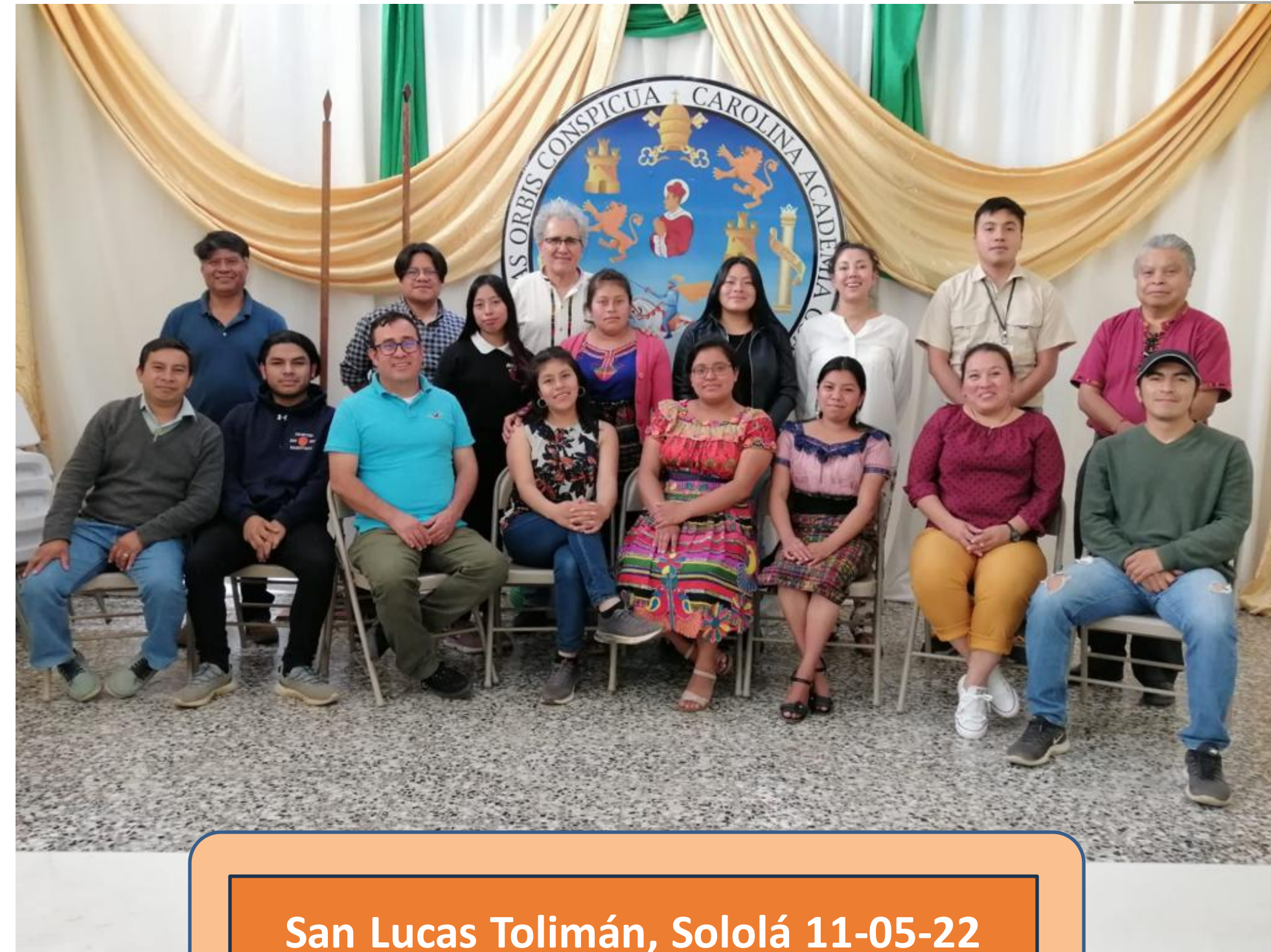
San Lucas Tolimán, Sololá 11-05-22