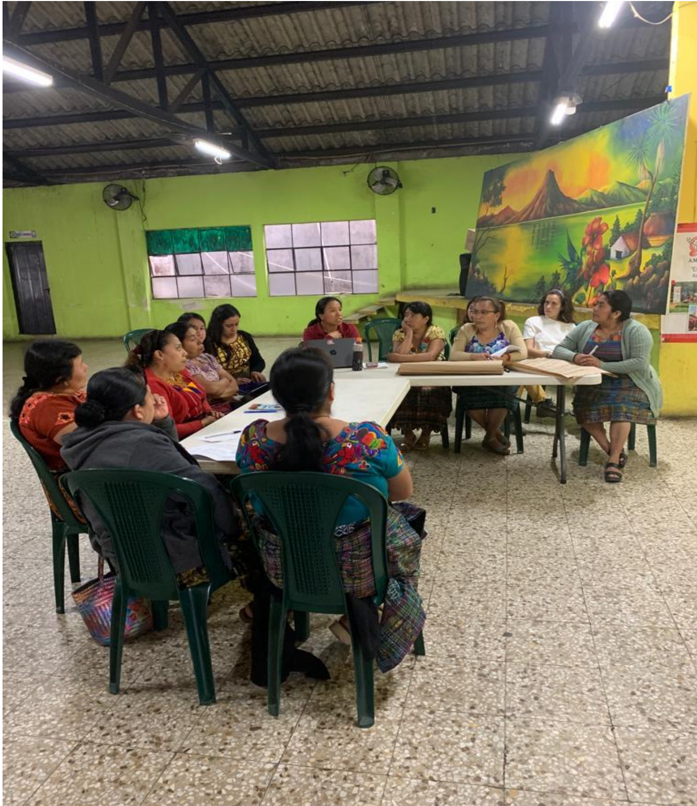
San Pedro La Laguna, Sololá, 12 mayo 2023